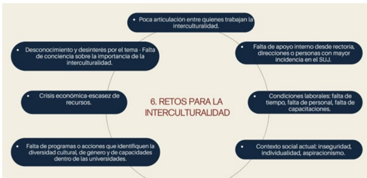
Figura 3. Retos interculturales en el SUJ.