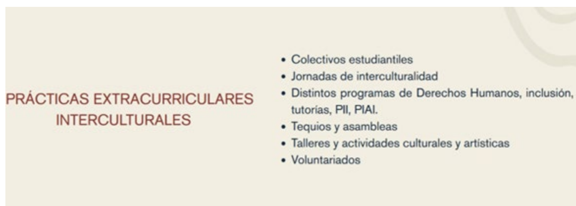
Figura 2. Prácticas extracurriculares interculturales en el SUJ.